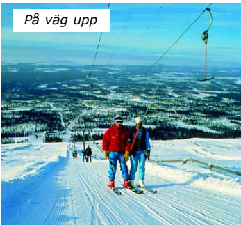
På väg upp