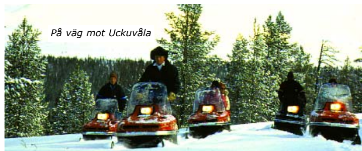
På väg mot Uckuvåla