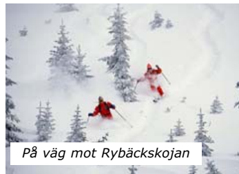
På väg mot Rybäckskojan