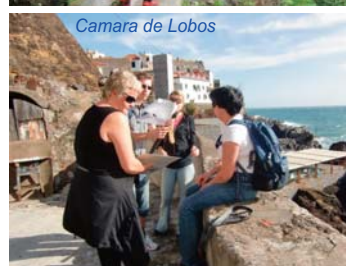
Camara de Lobos