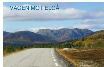
VÄGEN MOT ELGÅ